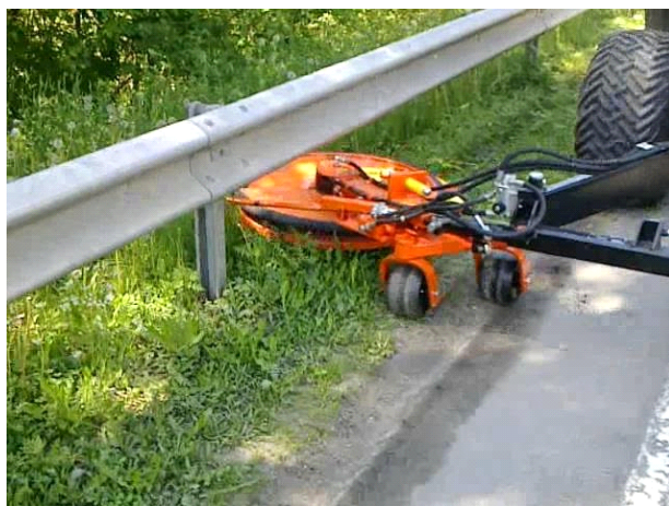
Desbrozadora mecánica en cuneta con señalización vial.