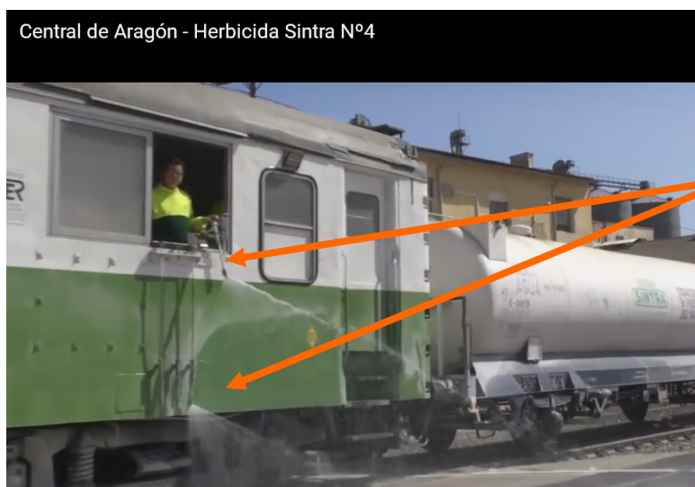
Imagen 3: Tren Herbicida en Aragón para el control de la vegetación con glifosato.

Aplicación de glifosato: Una pistola a presión dirigida manualmente (ángulo variable) y varias bocas fijas en la parte inferior.