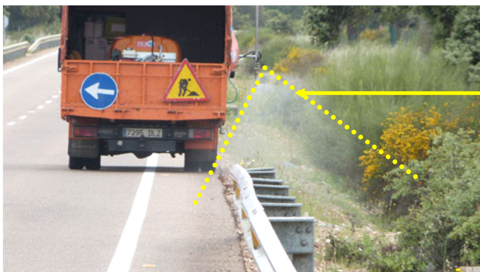
Imagen 1 – Método utilizado para la aplicación de herbicida en carreteras.

Aplicación del herbicida con afecciones a flora y fauna